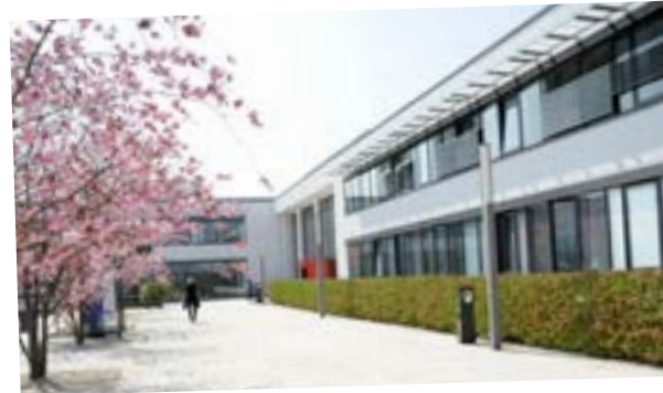
medius KLINIK NÜRTINGEN