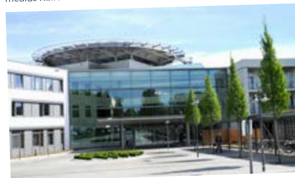
medius KLINIK OSTFILDERN-RUIT