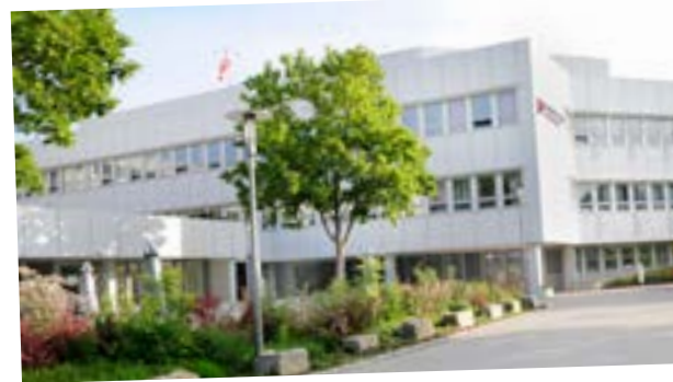
medius KLINIK KIRCHHEIM

Damit das so bleibt und sogar noch besser wird, braucht es hervorragende Bildungsangebote. Deshalb betreiben wir die Berufsfachschulen für Pflege in Nürtingen und Ostfildern-Ruit sowie die Akademie in Kirchheim unter Teck. Darüber hinaus kooperieren wir mit verschiedenen Berufsfach- und Hochschulen und sind akademisches Lehrkrankenhaus der Universität Tübingen.